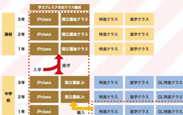
※ 2024年度入学生のイメージです。